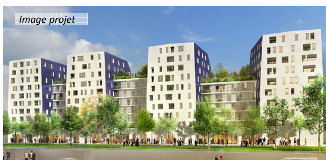
Ilot 10 – Lilas Sun – 150 logements – ANMA