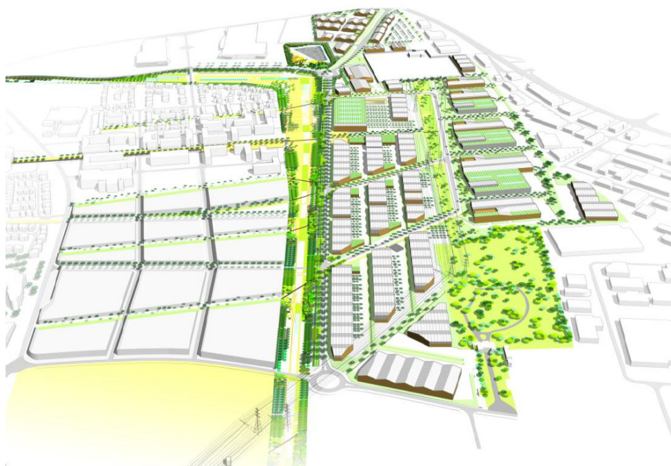
Plan de masse – Crédit Benjamin Fleury