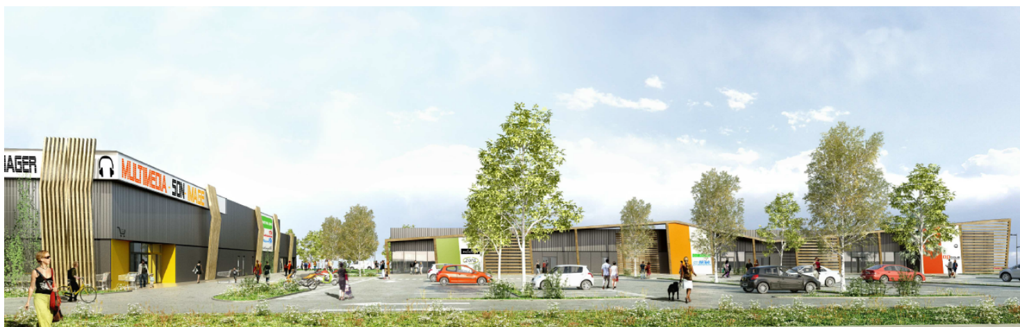
Perspectives du Retail park – Crédit photo : Monique Labbé