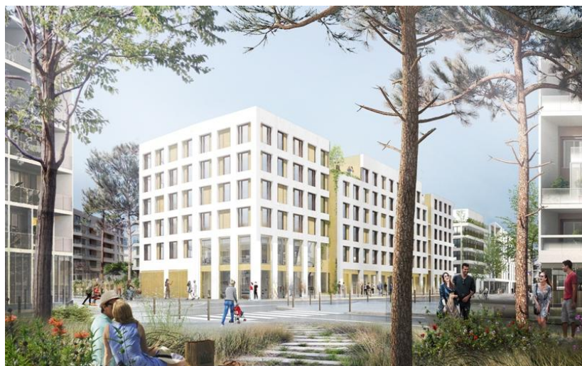
Perspective depuis la rue

Le périmètre Ouest du quartier Moulon fait partie des premières réalisations mises en œuvre dans le cadre de la ZAC du Moulon et, à plus grande échelle, du réaménagement du Sud du plateau de Saclay. Il représente l'une des premières pierres d'une vaste opération d'aménagement à travers laquelle se déclinent des enjeux à la fois territoriaux, urbains et architecturaux qui serviront de référence pour le développement de l'ensemble de cette zone.