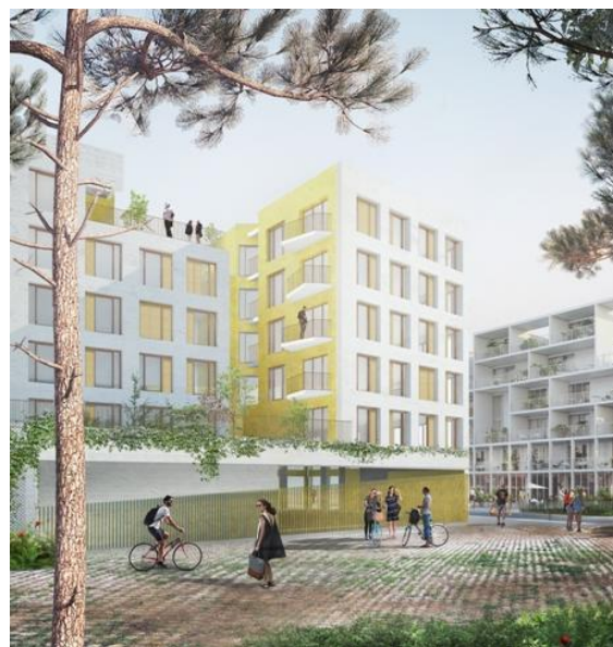
Vue du sillon