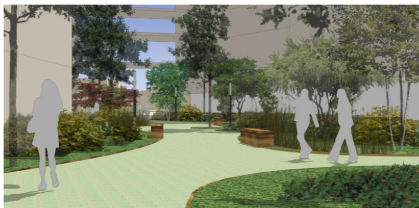
Ambiance du sillon