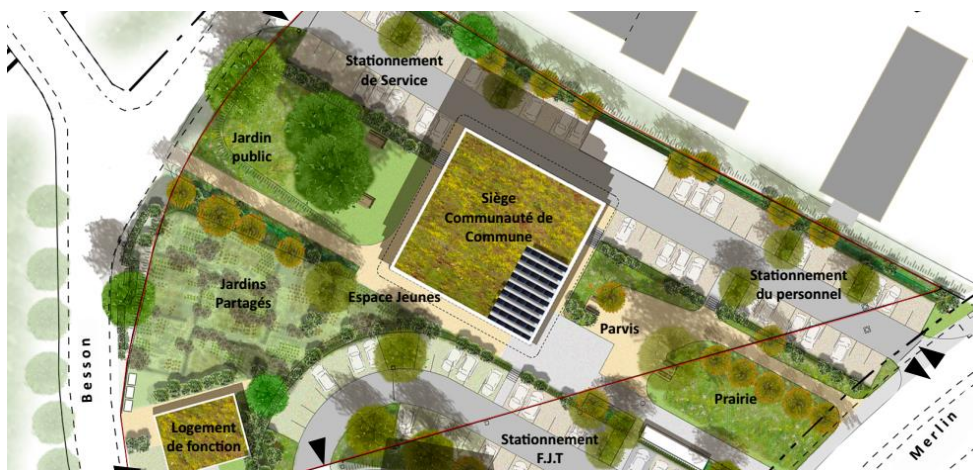
Plan masse du projet

Vizea, avec ABAMO & CO, accompagne la Communauté de Communes Cœur de Savoie dans la définition des objectifs environnementaux et particulièrement sur le thème de l'énergie.