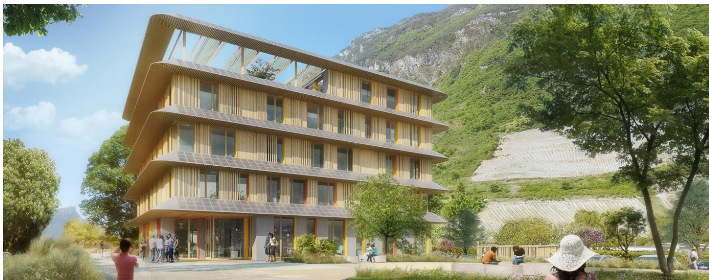
Perspective du projet lauréat

La volonté très forte de la maîtrise d'ouvrage de faire un projet exemplaire, qui puisse inspirer les autres acteurs du territoire et permettre d'innover se traduit par un démarche très poussée sur l'aspect énergétique : labellisation E+ C-, labellisation BEPOS, stockage de l'électricité photovoltaïque produite (en lien avec des entreprises innovantes du territoire).