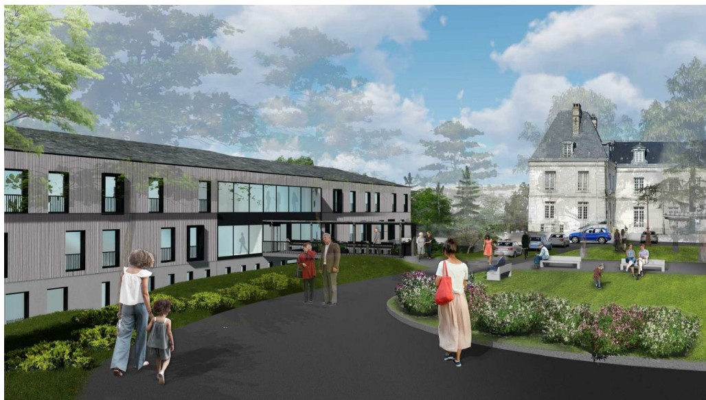
Perspective du projet