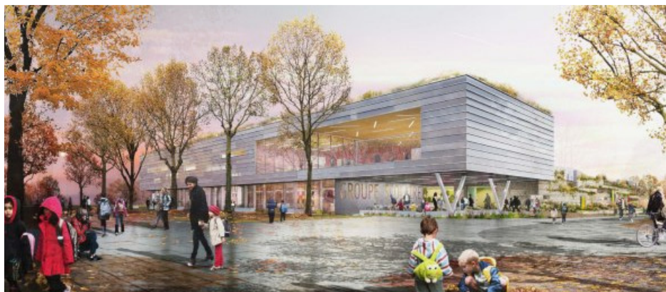
Perspective du bâtiment