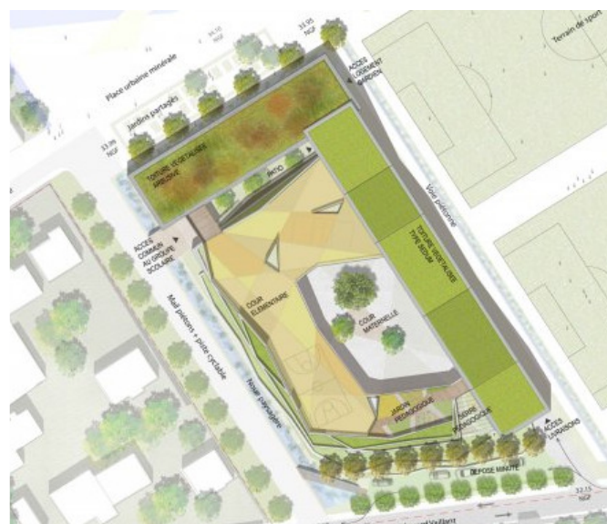
Plan de masse