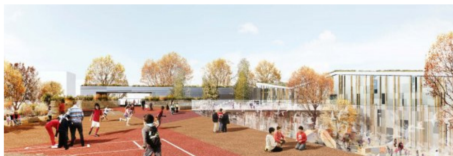
Vue depuis la cour de récréation