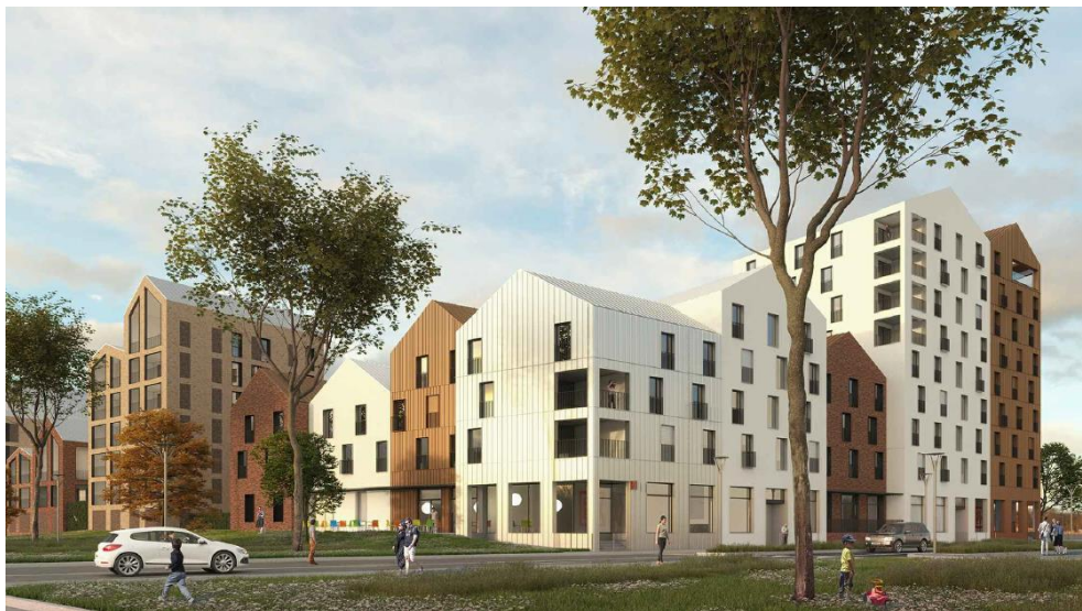
Perspective du plot A