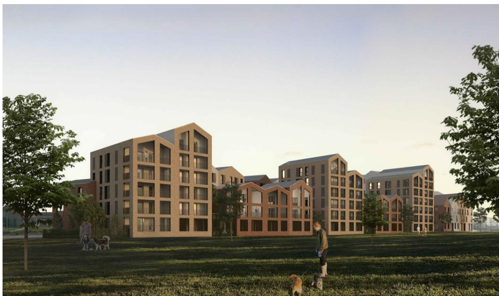
Perspective du plot D

Le projet s'implante dans le quartier des bassins à flot situé au nord de Bordeaux. Le choix des matériaux évoquant le passé industriel et portuaire du lieu, ainsi que l'existence d'espaces extérieurs généreux sont autant de spécificités participant à la cohérence architecturale du lieu. Le quartier offre un territoire unique pour l'accueil de nouveaux logements et espaces de vie. En conciliant enjeux environnementaux, avec notamment la préservation des cœurs d'îlots, et enjeux de développement économique et social sur ce territoire, le projet Bi Novello s'intègre au tissu urbain et propose un large espace de Co-living (Plot A) en accord avec les objectifs de la ville de Bordeaux.