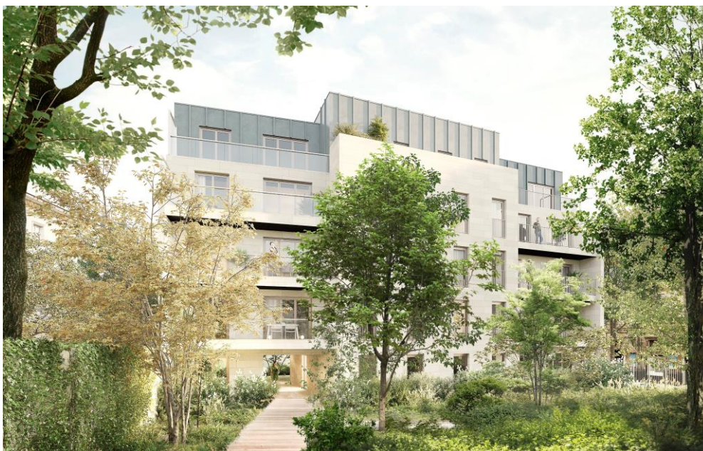
Vue du cœur d'îlot

L'opération de la résidence de l'entré du parc s'inscrit dans un contexte urbain dense et permet de requalifier le centre-ville de Maisons-Laffitte en proposant une offre de logements diversifiée répondant aux besoins de la ville.