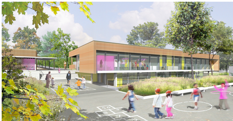
Vue de la cour récréation