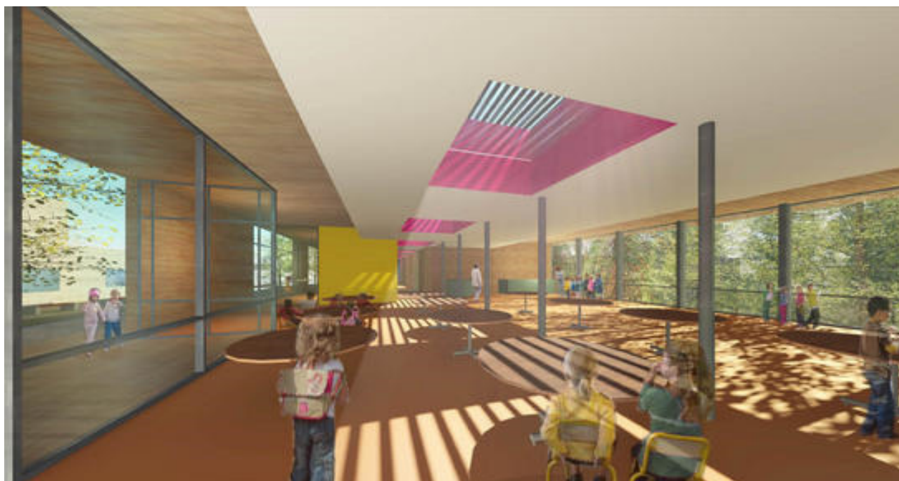
Vue du hall

Ce groupe est constitué d'un pôle scolaire et de centre de loisirs. Le projet de réhabilitation prévoit notamment l'extension des locaux de la restauration ainsi que l'acquisition de nouveaux emplacements destinés aux espaces culturels et aux logements de fonction. Dans ce cadre, la ville de Longjumeau a souhaité d'obtenir la certification Bâtiment tertiaire afin d'offrir aux usagers des conditions d'accueil et de confort satisfaisantes tout en maîtrisant les impacts des bâtiments sur l'environnement.