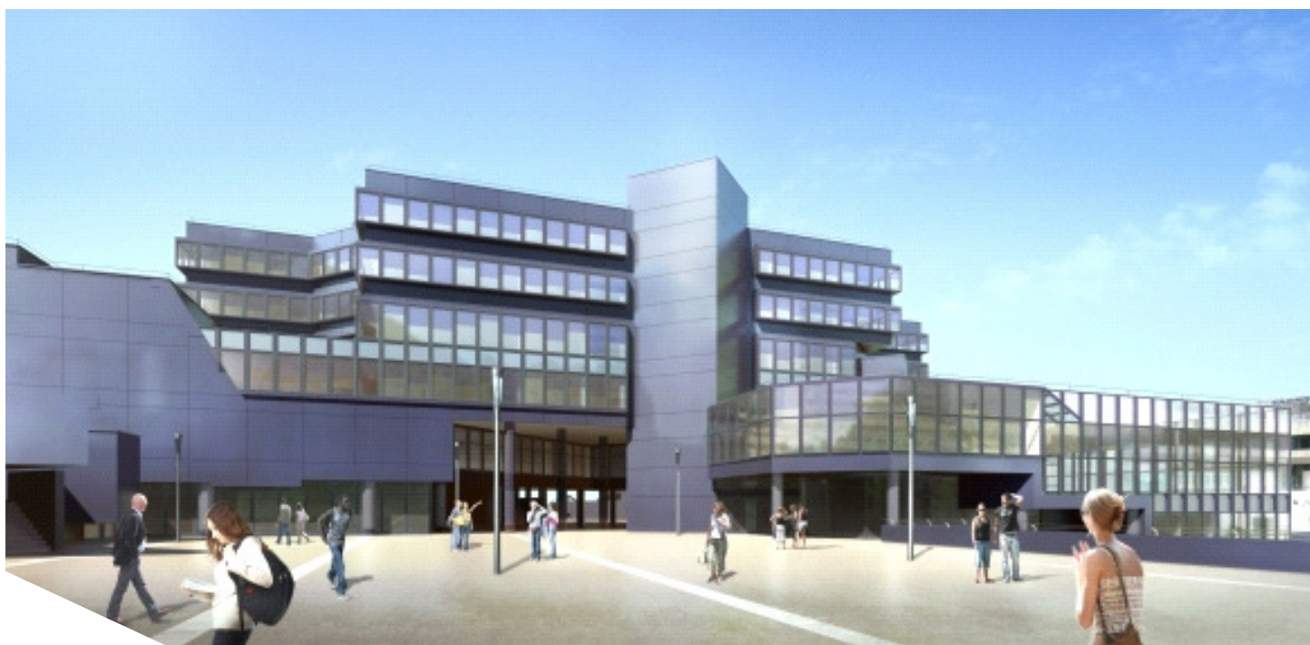
Réhabilitation de l'enveloppe du centre culturel et administratif

La Communauté d'Agglomération souhaite que ce bâtiment s'inscrive dans une démarche globale de Haute Qualité Environnementale présentant un niveau de performance énergétique certifié BBC rénovation tout en visant les objectifs du facteur 4 dans le cadre de son Agenda 21. La MOA souhaite à travers cette démarche créer un environnement confortable et sain pour ses utilisateurs, préserver les ressources naturelles en optimisant leur usage et maîtriser les coûts d'exploitation.