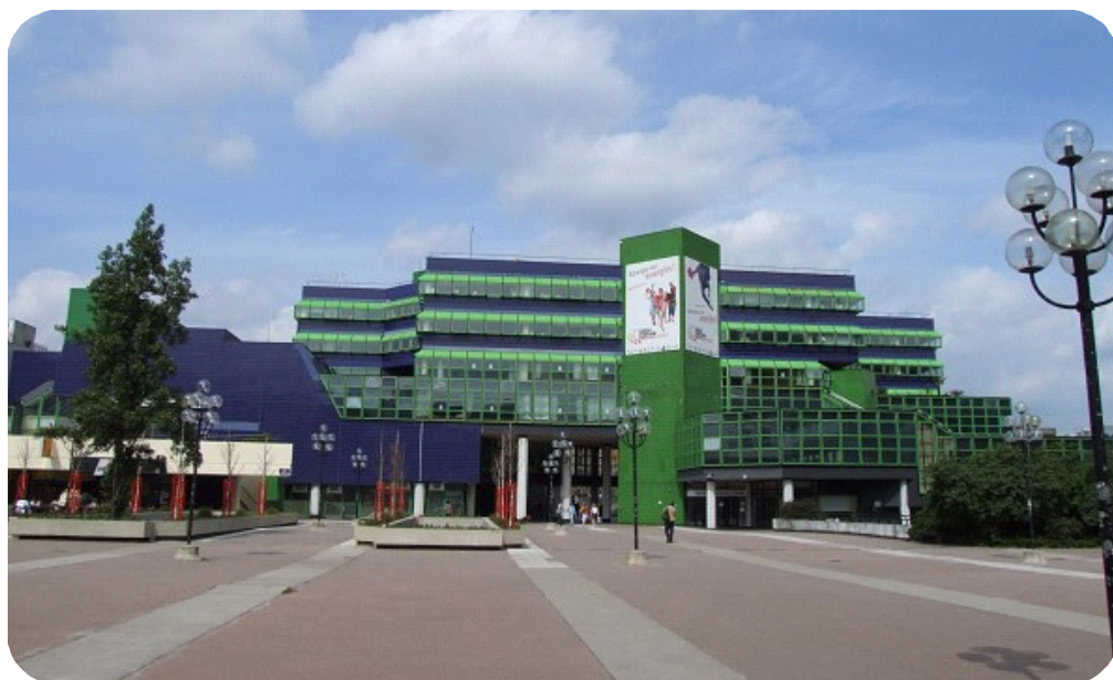
Centre culturel et administratif de Cergy