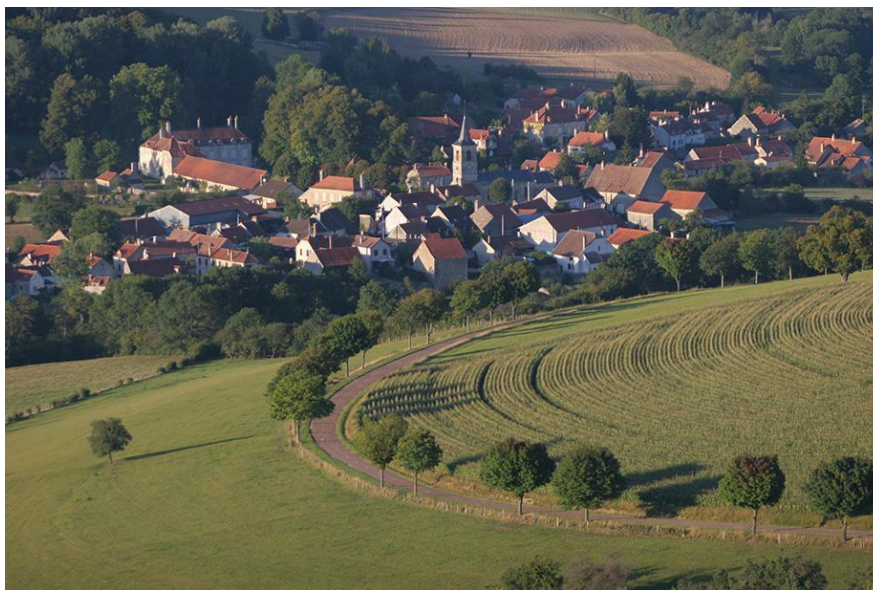
PHOTOGRAPHIE DU PAYS CHATILLONNAIS

La Communauté de communes du Pays Châtillonnais est la deuxième plus grande intercommunalité de France. Cette caractéristique rend l'élaboration de son PCAET complexe. Le territoire s'étalant sur 1 1821 km 2 , les enjeux Air Energie Climat ne sont pas les mêmes dans toutes les parties du territoire. Bien que la communauté soit majoritairement rurale et peu dense, certains particularismes doivent être pris en compte dans le plan d'actions.