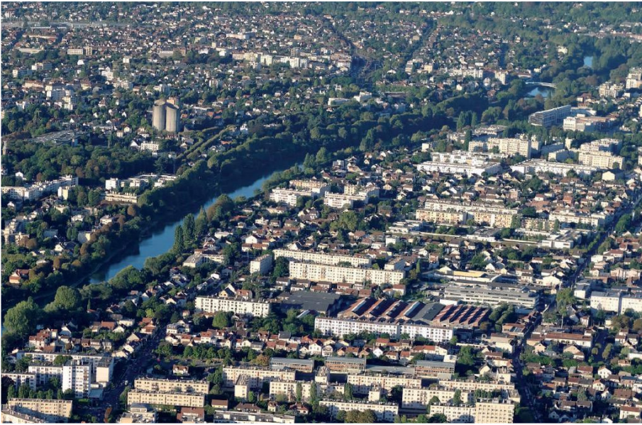
Vue aérienne de la Marne à Paris Est Marne et Bois

L'Etablissement Public Territorial Paris Est Marne et Bois est issue de la fusion en 2016 de neuf communes isolées (Bry-sur-Marne, Champigny-sur-Marne, Fontenay-sous-Bois, Joinville-le-Pont, Maisons-Alfort, Saint-Mandé, Saint-Maur-des-Fossés, Villiers-sur-Marne, et Vincennes), une communauté de commune (Charenton-le-Pont et Saint-Maurice) et une communauté d'agglomération (Communauté d'agglomération de la Vallée de la Marne regroupant le Perreux-sur-Marne et Nogent-sur-Marne). Son engagement pour la transition écologique et énergétique se traduit avec la réalisation de son PCAET témoignent de fortes ambitions qui se retrouveront dans le PLUi.