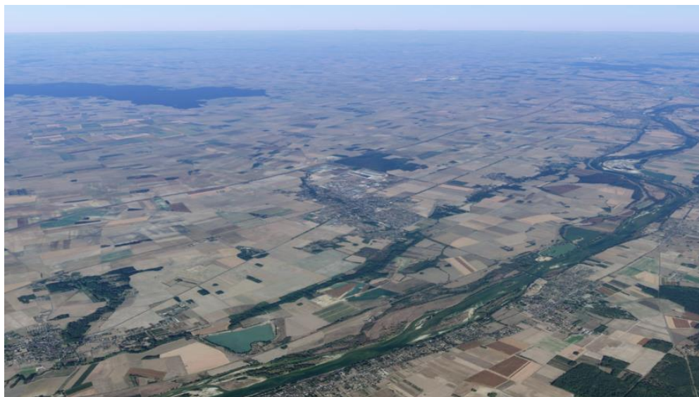
Vue aérienne de la Cisse

La Communauté de communes Beauce Val de Loire est issue de la fusion récente de deux communautés de communes (Beauce et Forêt et Beauce Ligérienne). Son engagement volontaire dans l'élaboration d'un Programme Local de l'Habitat et dans une entente intercommunautaire avec le Grand Chambord témoignent de l'opportunité de ces rapprochements intercommunaux pour le développement du territoire.