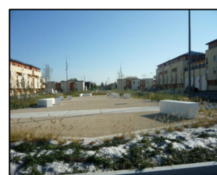
Vues du site