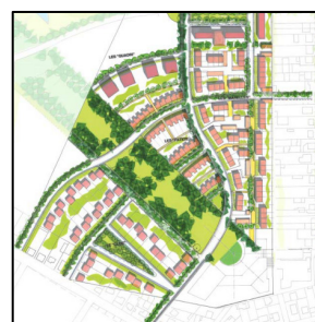
Trame paysagère – PADD – Mitry