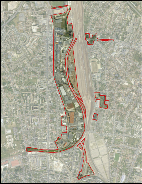
Vue aérienne du site avant projet