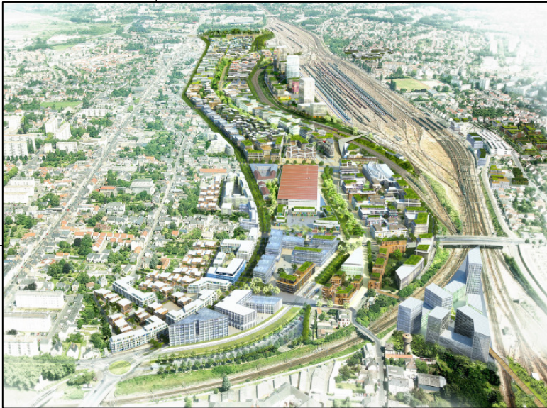
Perspective du projet