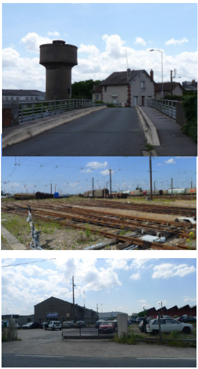
Vues du site actuel

Le secteur Dessaux – Les Aubrais est situé dans la partie nord de l'agglomération Orléanaise, sur les communes de Fleury-les-Aubrais (majoritairement) et d'Orléans. D'une superficie de 110 ha, ce site est actuellement occupé par des activités industrielles et fait l'objet d'une requalification urbaine majeure. La maîtrise d'ouvrage souhaite en effet reconstruire un véritable morceau de ville, attractif à l'échelle métropolitaine et vertueux d'un point de vue environnemental. Aussi le futur quartier fait aussi l'objet de mixités économique et sociale, ainsi que d'une réflexion approfondie sur la trame verte et bleue et sur les mobilités.