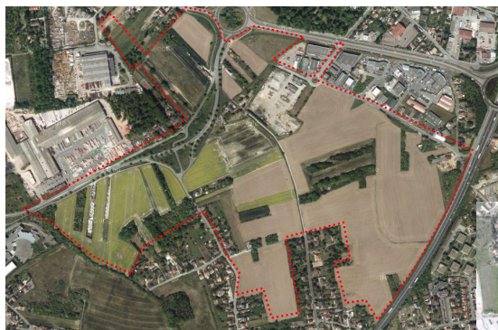
Vue aérienne du site avant projet