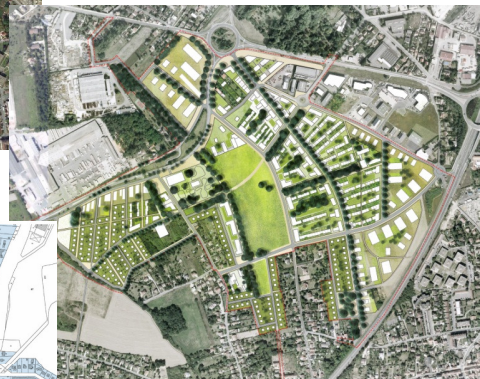
Perspective du projet