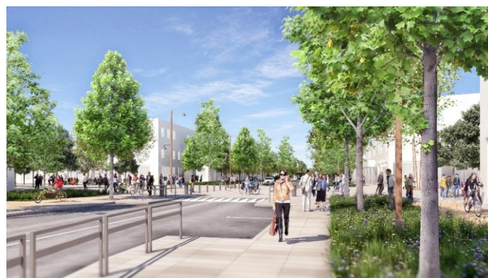
NOUVELLE CENTRALITE URBAINE DE LA ZAC

Localisé entre le bourg de Coupvray et le développement du centre urbain du Val d'Europe, le site du futur EcoQuartier Coupvray/3 Ormes constitue une véritable opportunité de développement urbain et de consolidation de l'identité territoriale à l'échelle de la commune mais aussi de l'agglomération. La ZAC s'inscrit dans la 4 ème phase de développement du projet de Marne-la-Vallée.