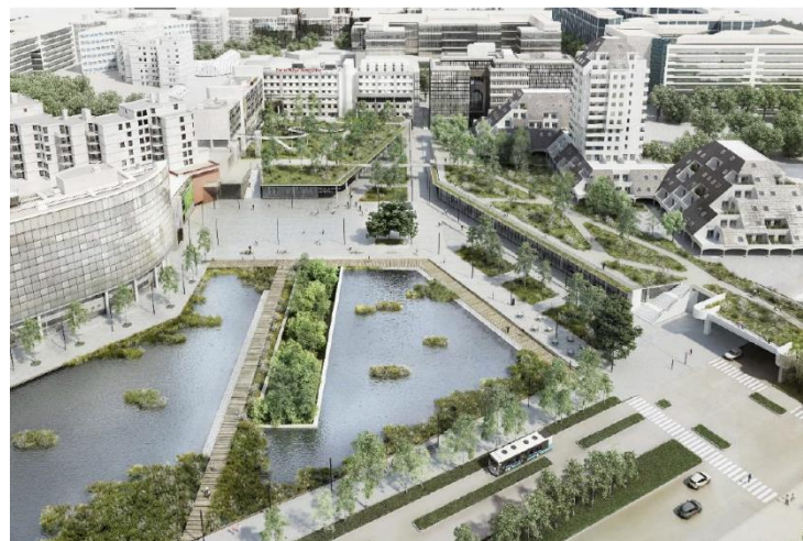
VUE SUR L'ESPLANADE DE LA COMMUNE DE PARIS

DEFINITION DU ROLE DE CHACUN POUR ASSURER LE RESPECT DE LA CHARTE « CHANTIER VERT »