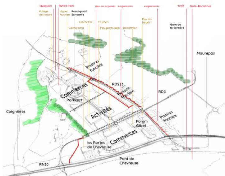
Schéma de l'organisation actuelle du site

Le projet s'étend sur 180 ha d'espaces commerciaux et sur deux zones principales : la zone commerciale de Pariwest et la zone commerciale de Coignières avec Forum Gibet (50ha) et les Portes de Chevreuse (13ha). Le projet s'inscrit dans un secteur en pleine mutation, localisé de manière stratégique en entrée de ville et constituant un pôle d'emploi majeur.