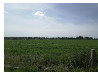
Vues sur les zones agricoles et forestières à l'ouest du site