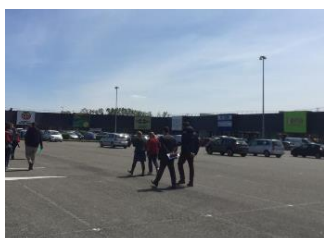
Vues du site