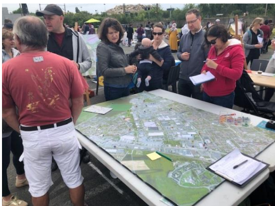
Atelier de concertation Justmap avec les habitants lors du vide grenier de Coignières et Maurepas