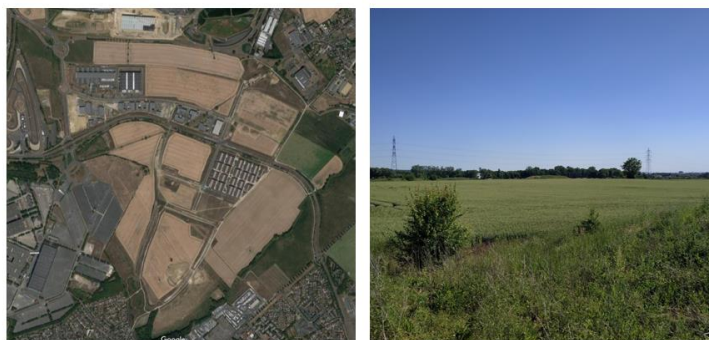
VUE AERIEENNE ET PHOTO PRISE SUR SITE A L'ETAT INITIAL

La ZAC AéroliansParis est située à 35km au Nord de Paris, à proximité immédiate de l'aéroport Charles de Gaulle et du parc des expositions de Tremblay-en-France. La ZAC recouvre une surface de 200 hectares environ, sur des espaces agricoles, ce qui fait du site une des dernière zone proche de Paris non encore urbanisée. Le projet a pour ambition la création d'une future zone d'activité (ZAE) composée majoritairement d'entrepôts logistiques et de bureaux. Toutefois, la ZAC propose une programmation diversifiée, avec un centre commercial et des ensembles hôteliers. Avec 70% des surfaces commercialisées et 30% construites, l'opération AéroliansParis entame sa dixième phase opérationnelle du quartier Nord-Ouest, central et Sud-Est.