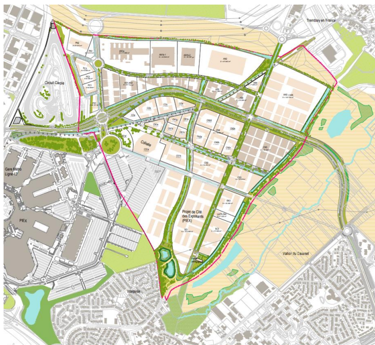
PLAN MASSE D'AÉROLIANSPARIS