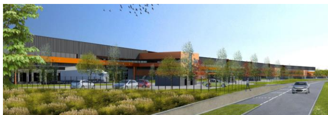
MODELISATION DES FUTURES IMPLANTATIONS D'AÉROLIANSPARIS