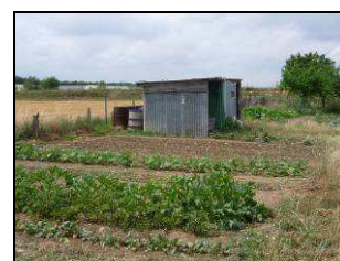
Vues du site, avec le Bois des Écouardes et ses jardins familiaux,