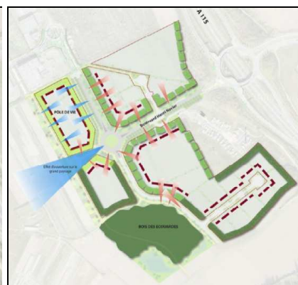
Aménagement paysager et environnemental