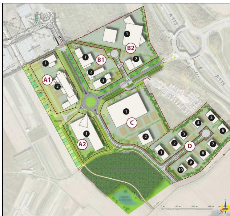
Plan masse du projet de la ZAE des Écouardes

D'une surface de 18,6 hectares, cette zone doit permettre à la commune de poursuivre son développement économique, industriel, artisanal et tertiaire et de conforter sa vocation de pôle économique dans la Vallée de Montmorency.