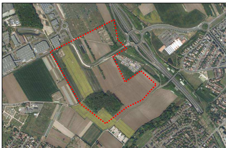
Vue aérienne du site